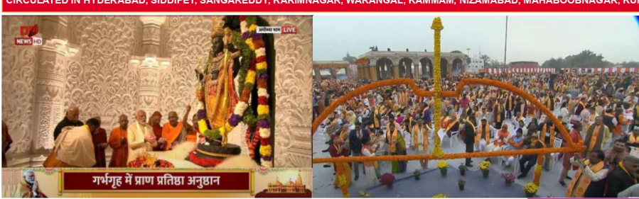
గాంధీజీ సేవ ప్రతిష్ఠా ఆగ్రహారం